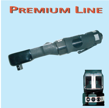
UT 8015 NR 1/2"