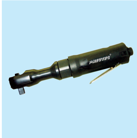
UT 8015 RE 1/2"