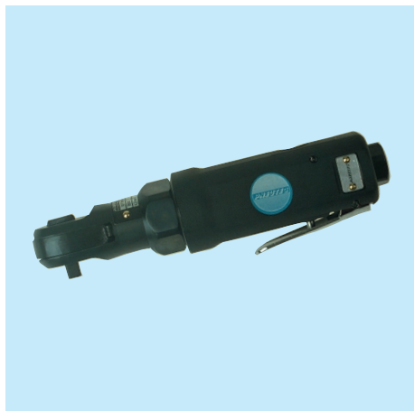
UT 8000 A2 1/4"