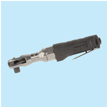
UT 5015 C 1/2"