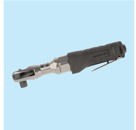
UT 5005 C 3/8"