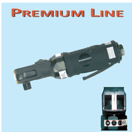
UT 8000 NR 3/8"