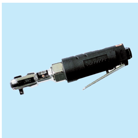
UT 8000 D 3/8"