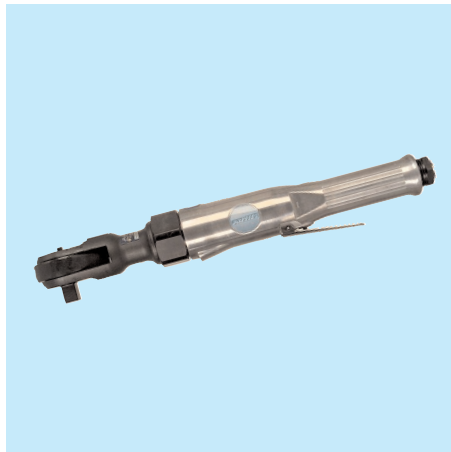
UT 8018 1/2"