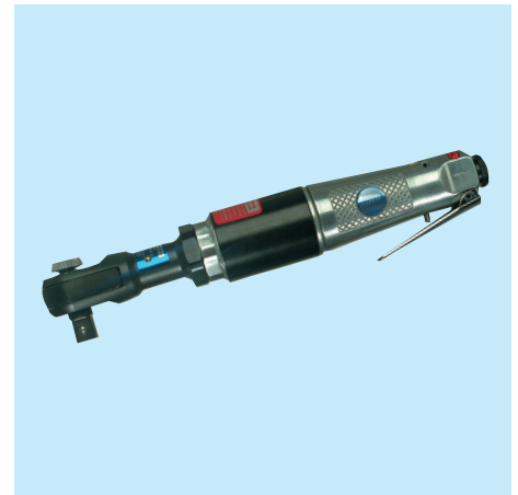
UT 8011 1/2"